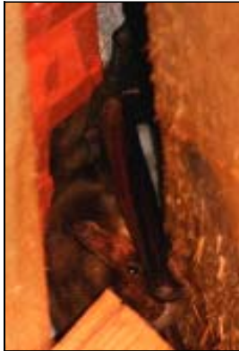
Großes Mausohr wohnt gern im Speicher

Eine nur ca. 5gr. leichte Zwergfledermaus vertilgt bis zu 50000 Mücken pro Jahr.