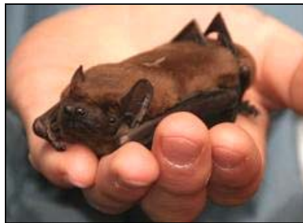
Großer Abendsegler Liebt Spalten in hohen Gebäuden