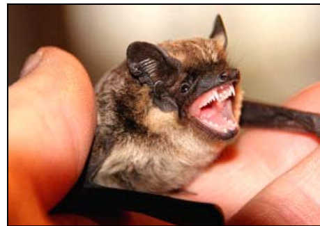
Zweifarbflodermaus hält sich gerne in Spaltenquartieren auf